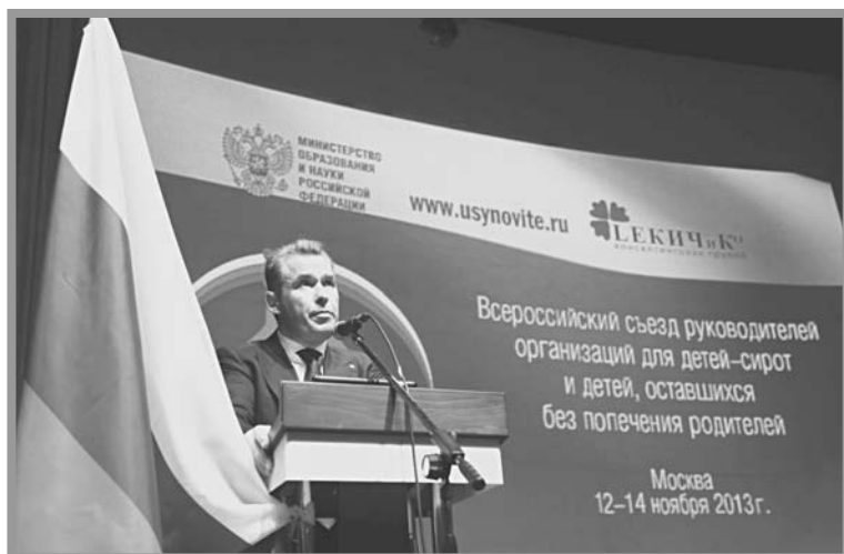
Уполномоченный при Президенте Российской Федерации по правам ребенка Павел Астахов

оритетом государственной политики в отношении детей-сирот. При этом необходим взвешенный подход к реформированию детских домов и интернатных учреждений.